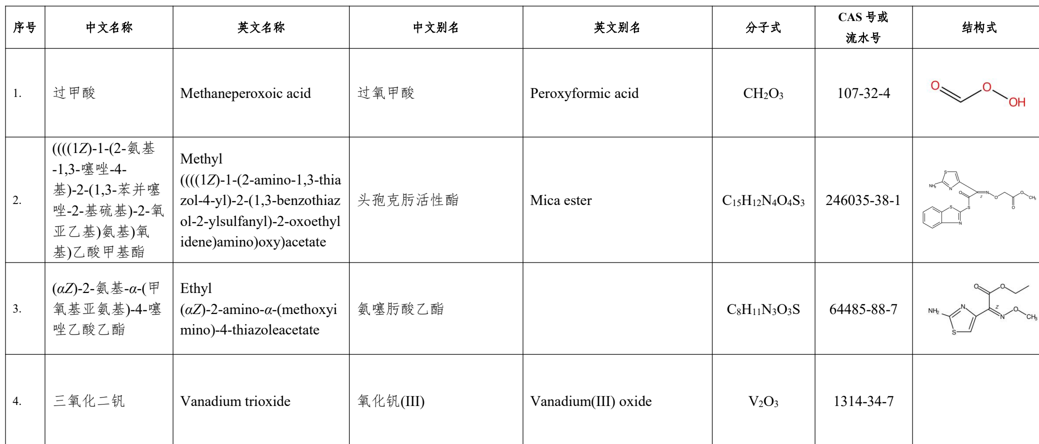
2024 年第 1 批（总第 11 批）拟增补列入《中国现有化学物质名录》的化学物质信息表